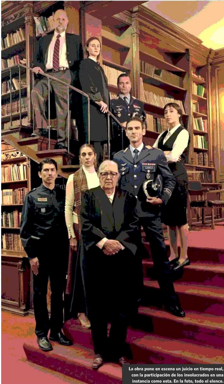
La obra pone en escena un juicio en tiempo real, con la participación de los involucrados en una instancia como esta. En la foto, todo el elenco.

do eso. Entonces, es muy interesante el giro de poder hablar de una obra compleja, pero con temas cercanos. En ese sentido, democratiza bastante el trabajo y la cercanía del espectador al teatro. Es una obra que, si bien suena compleja, en términos generales yo la considero bastante simple. Hay una persona que cometió un delito buscando un bien común y eso es lo que se juzga. Y ahí todos los espectadores se sienten con un poder de decidir, se sienten identificados, tienen ganas de comentarlo. Y eso ha sido muy interesante”, destaca el actor.