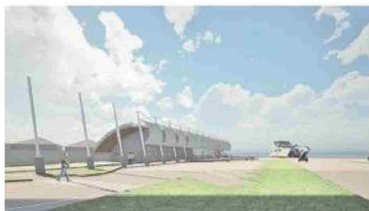
Imagen virtual del terminal de pasajeros en bahía Catalina.

fronterizo del Paso Río Guillermo, en Cerro Castillo. Marusic lo describió como el más ambicioso de los cuatro: se emplazará en un terreno de 60.000 metros cuadrados, con entre 5.000 y 6.000 metros cuadrados