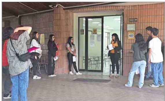
SEDES. — La U. de Talca sirvió como uno de los 758 locales de rendición que hay en todo el país.

Tiraje: 126.654 Lectoría: 320.543 Favorabilidad: No Definida