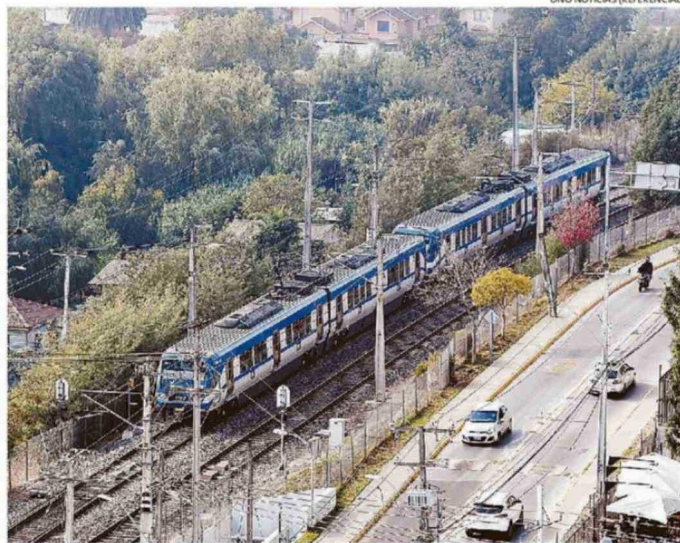
NUEVAS ESTACIONES SERÍAN: SAN PEDRO, QUILLOTA SUR, QUILLOTA CENTRO, LA CRUZ Y GUERRA.

Desde la estatal detallaron que el plan considera una inversión de 811 millones de dólares y la construcción de 26 kilómetros de vías. En total, se proyectan