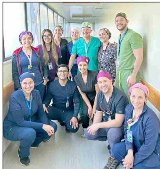
Este es el equipo que realizó las intervenciones gratuitas.

especialmente a la Corporación y su equipo, a la Dirección del Hospital que nos ha apoyado siempre en las diversas estrategias para disminuir las listas de espera y en tercer lugar, a la Unidad Pre quirúrgica, la cual ordenó todo lo que significa tener a todos los pacientes preparados para las intervenciones», agregó.