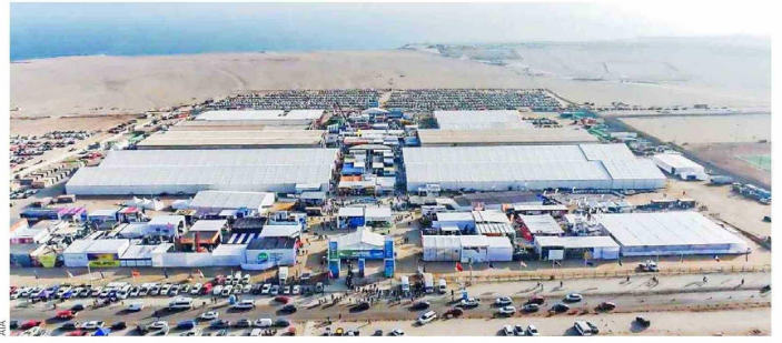
Exponor 2026 proyecta una participación récord de empresas en un contexto de expansión de la industria minera, consolidándose como un espacio clave para el encuentro y generación de nuevos negocios.

El nuevo ciclo de expansión que vive la industria minera comienza a reflejarse con fuerza en la próxima versión de Exponor 2026, exhibición internacional organizada por la Asociación de Industriales de Antofagasta (AIA) que este año alcanzará un total de 1.300 empresas expositoras, cifra récord que confirma el interés del sector por fortalecer sus redes comerciales y proyectar nuevas oportunidades de negocio.