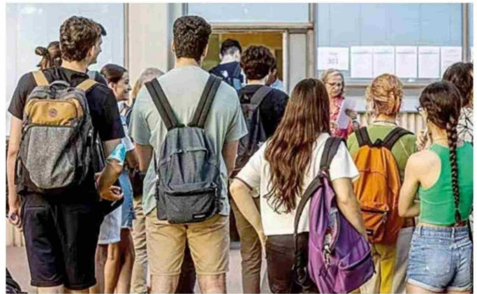
Luego de dar la PAES, los estudiantes pudieron postular a la gratuidad y otras becas en el FUAS.

que deseen acceder al beneficio estatal, deben haber completado el FUAS en el periodo correspondiente. También, luego de haber revisado la información del Nivel Socioeconómico (que se publicó hace una semana).