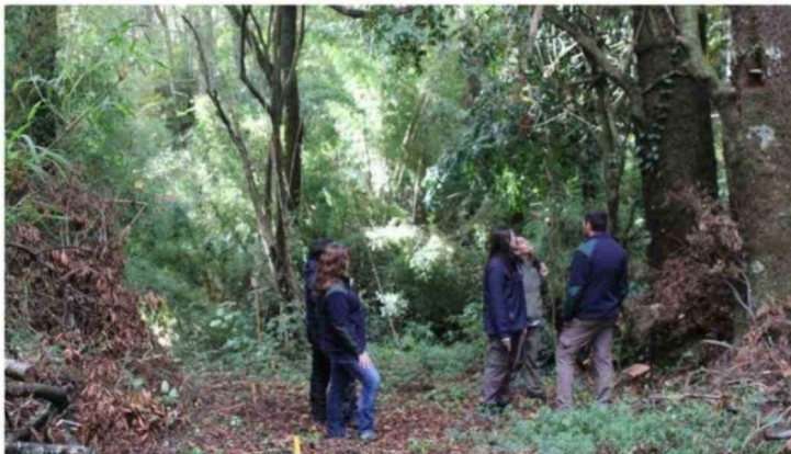
LA ACTIVIDAD PERMITIÓ ACERCAR LA INFORMACIÓN A PROPIETARIOS Y COMUNIDADES RURALES, DANDO A CONOCER LOS BENEFICIOS DEL INSTRUMENTO.

Asimismo, destacó el valor educativo y turístico de la iniciativa. "Hoy vienen niños, vi-