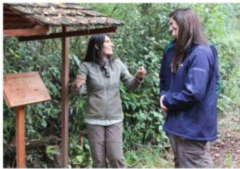
CONAF DISPONE DE EXTENSIONISTAS FORESTALES QUE BRINDAN ASESORÍA TÉCNICA A PEQUEÑOS PROPIETARIOS.