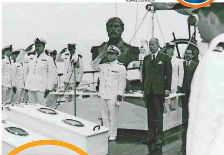
ENTREGA OFICIAL DEL BUSTO EN BRONCE A FUERZA MARÍTIMA DE JAPÓN.