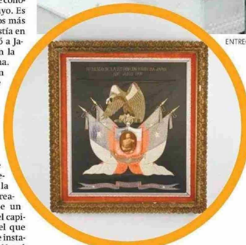
CUADRO DE PRAT ENTREGADO EN 1908 A CORBETA BAQUEDANO.

rra de paz" y es ahí donde descansan los espíritus de los guerreros japoneses. "No es un cementerio, pero están los kamis. Un kami es el espíritu de un guerrero que luego de su propósito de vida llegan a ese estado. Ahí están los nombres de las personas que lucharon por la grandeza de Japón".