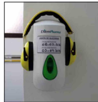
Trabajo ha permitido generar un espacio seguro para los menores con TEA.

Por este motivo, tanto sus gestoras, como las autoridades e invitados en la presentación del mismo, compartieron la opinión que es replicable en otros establecimientos de salud públicos y privados.