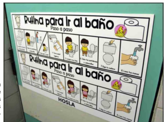
Estas son parte de las medidas adopta-