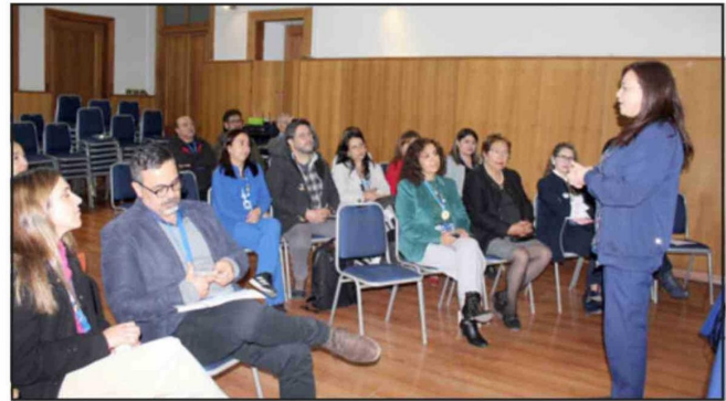
Equipo de profesionales generó esta pionera iniciativa.

«Este proyecto surgió de un grupo de profesionales de