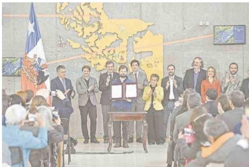
El Pacto Magallanes por el Hidrógeno Verde es un acuerdo público-privado sellado en diciembre de 2023 con la presencia del Presidente Gabriel Boric para impulsar la industria local del H2V. En la foto, el Mandatario junto a sus ministros y representantes de H2V Magallanes en dependencias del Cijum.

Como antecedente previo a esta eventual caída en dominó estuvo la decisión de EDF (Electricité de France) Power Solutions de "detener" su proyecto de hidrógeno verde a gran escala conocido como Energía Verde Austral (Eva), en Cabo Negro. Esto sucedió a principios de diciembre del año pasado. La empresa argumentó una revisión estratégica y una evolución más lenta del mercado.