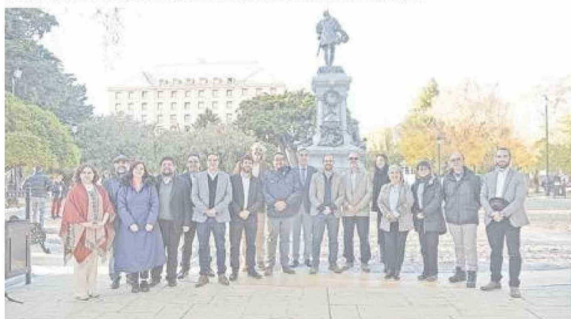
En la foto, los asistentes a la tercera sesión de la Mesa Estratégica enmarcada en el Pacto Magallanes que se celebró en Punta Arenas el 17 de mayo de 2024.

Ya esta salida precipitó la incertidumbre en el sector, puesto que EDF era una de las principales impulsoras del H2V en Magallanes.