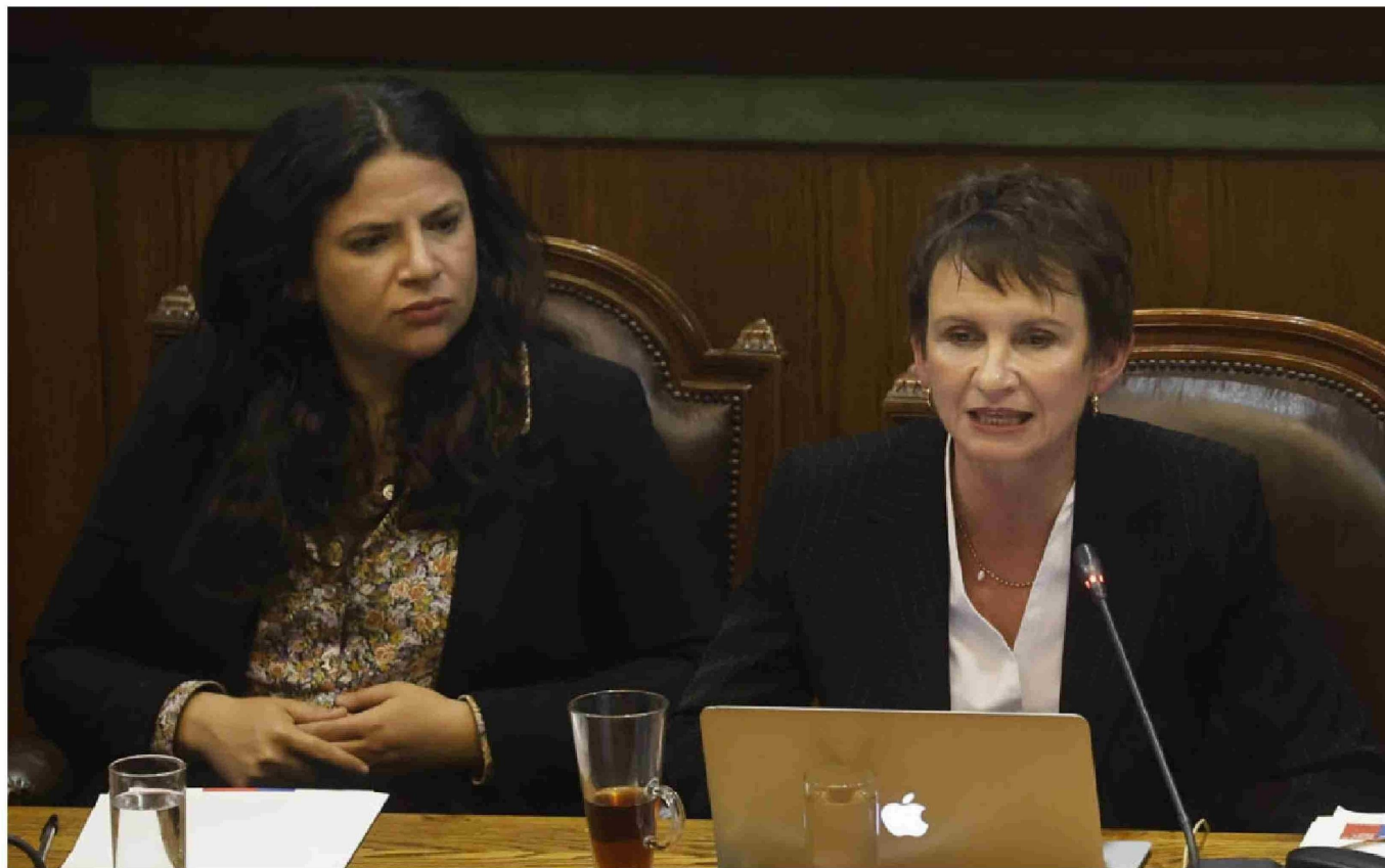
► Tras el caso Monsalve, la oposición ha centrado sus críticas en las ministras Orellana (Mujer) y Tohá (Interior).

Tiraje: 78.224 Lectoría: 253.149 Favorabilidad: No Definida