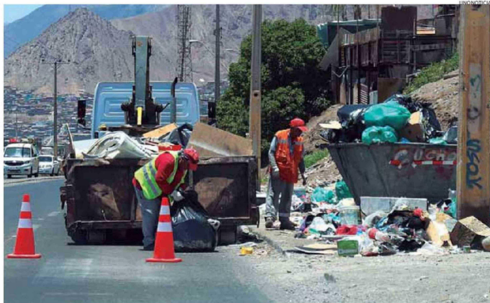
A PESAR DE CONTAR CON RECOLECCIÓN DIARIA DE BASURA, SE SIGUE ACUMULANDO DESECHOS.

"A nivel de Padre Hurtado y en gran parte de su extensión, pasa eso, si uno va caminando