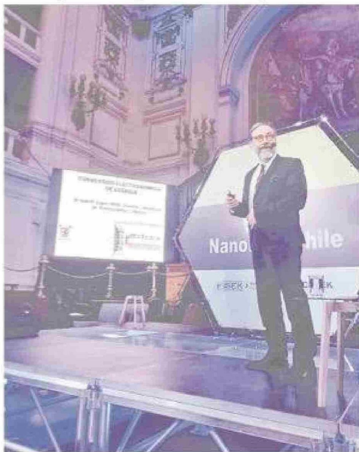
Desde hace décadas es profesor titular y académico distinguido de la Facultad de Química y Biología de la Universidad de Santiago de Chile.

Al preguntarle qué le diría a un científico joven, responde sin dudar: "Acostúmbrate a errar muchas veces, porque el éxito está lleno de errores. Las cosas no funcionan a la primera. Y la persistencia del científico es clave: los mejores son quienes insisten, insisten e insisten, hasta que salen las cosas como uno quiere, o de otra forma, pero estamos descubriendo. No hay que darse por vencido". Agrega también que la creatividad la estimula la falta de medios: "Cuando viene todo empaquetado, uno no se va a transformar en un cineasta mirando películas todos los días. Hay que inventar una película. Lo mismo es la ciencia: hay que inventar ciencias". Y que la sorpresa es un motor que no hay que dejar apagarse. Cuando era niño se sorprendía todos los días con la luna, el cielo de verano en Talca, el puntito luminoso del Sputnik pasando sobre los techos. Hoy, confiesa, ya no presta tanta atención. Se acostumbró. Pero en un avión dice que lo observa con curiosidad y se pregunta por cada pieza que lo conforma, por cada tornillo, como el niño de Talca que hacía experimentos.