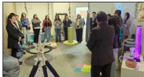
La nueva sala de neurobienestar cuenta con implementos sensoriales diseñados para apoyar la regulación emocional de los estudiantes.