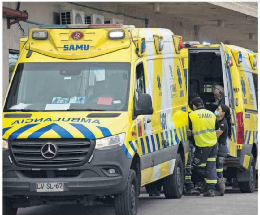
LA DIRECTORA DEL SERVICIO DE SALUD ASEGURÓ QUE ESTÁN EN PROCESO DE CUBRIR LA BRECHA.

"Cada nivel de atención coordina sus propios vehículos institucionales en el contexto de la atención habitual de cada dispositivo