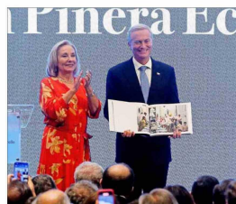
La ex primera Dama, Cecilia Morel, entregó al mandatario un libro con imágenes del fallecido expresidente Piñera.

Kast llegó a la UDD a las 16.30 hrs. Anteriormente, habían arribado al lugar los ministros de Interior, Segores, Vivienda, Cultura y Patrimonio. El mandatario habló alrededor de 20 minutos, en un discurso en el cual valoró la gestión y la figura de Piñera. Previo a su intervención, Kast saludó a Matthei, a