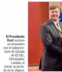
El Presidente Kast sostuvo un encuentro con el subsecretario de Estado de EE.UU., Christopher Landau, al iniciar su jornada en la vispera.