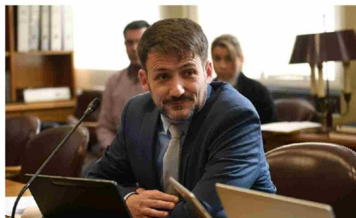
EL SUBSIDIO ELÉCTRICO alcanza hoy al 20% de los hogares del país, según cifras oficiales del Ministerio de Energía, encabezado por Diego Pardow.

Para hacer frente al alza en las cuentas de la luz, el Gobierno ha