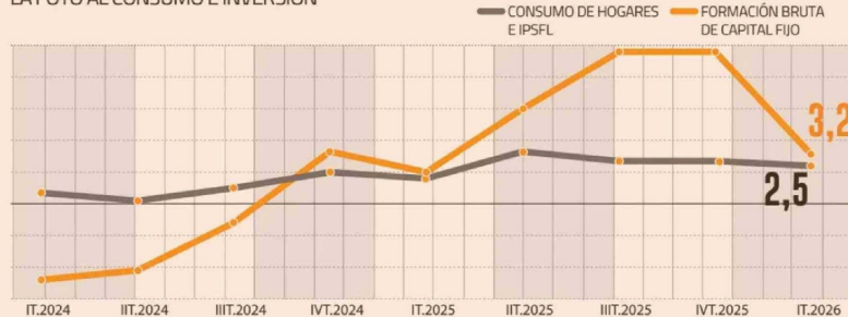
LA FOTO AL CONSUMO E INVERSIÓN