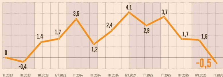
EVOLUCIÓN DEL PIB POR TRIMESTRE VARIACIÓN ANUAL (%)