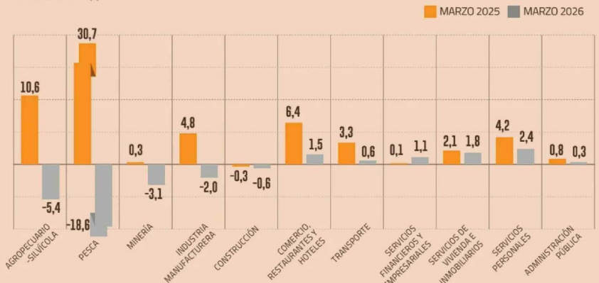
POR ACTIVIDAD SECTORIAL VARIACIÓN ANUAL (%)

En el terreno de las alzas, destacó la expansión de 2,4% que protagonizaron los servicios personales, impulsados por el quehacer en salud, sobre todo en lo que se refiere a las prestaciones realizadas en clínicas y centros médicos privados.