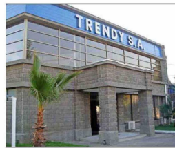
Trendy partió su fabricación en Quilicura, en calle Zañartu 11.

texto del país se complica; toda la familia regresa a España. En Chile, terceras personas quedaron a cargo del negocio.