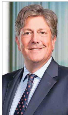
Nicolás Balmaceda, subsecretario de Obras Públicas.