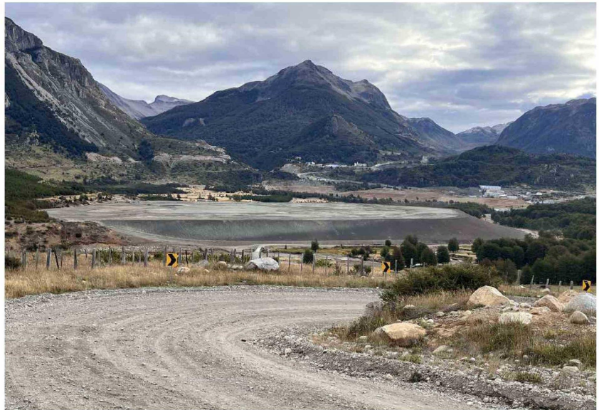
Sector Alto Mañihuales, ubicado en una zona de explotación minera