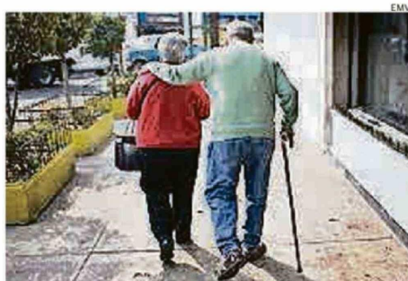
UN INFORME DEL INE REVELÓ QUE 15 DE LAS 21 COMUNAS DE ÑUBLE REGISTRAN ACTUALMENTE MÁS DEFUNCIONES QUE NACIMIENTOS

La situación regional se da en medio de un escenario histórico para Chile que me revela que durante 2025 el país alcanzó por primera