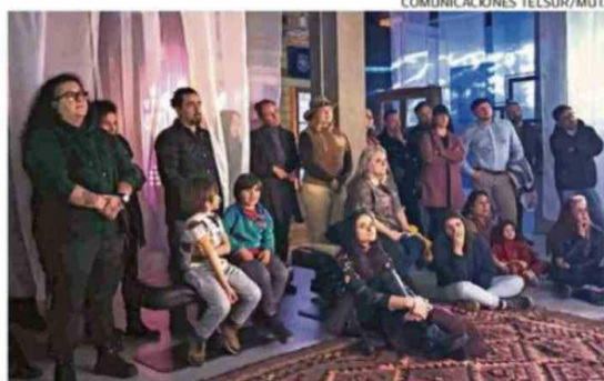
EL PÚBLICO ACOMPAÑÓ EN GRAN NÚMERO LA JORNADA INAUGURAL.

A través de un montaje fragmentado, "Voces del Sur" ofrece un recorrido íntimo cons-