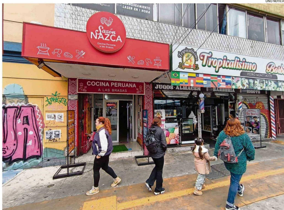
EL CLIENTE FUE ABORDADO EN EL INTERIOR DEL RESTAURANTE SAZÓN NAZCA ALREDEDOR DE LAS 16:30 HORAS DE ESTE MIÉRCOLES.

Hasta el cierre de esta edición no se había reportado la captura de estos sujetos (aparentemente me-