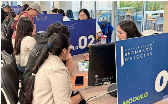
Durante el proceso 2026, la UBO fortaleció una estrategia de acompañamiento integral, que combinó atención presencial, canales digitales como una feria en metaverso, un agente con inteligencia artificial para la atención web y orientación personalizada.

“La UBO combina calidad académica con un fuerte foco en el acompañamiento académico, vocacional y socioemocional. Además, estudiar en una universidad adscrita a gratuidad, con carreras acreditadas y altos estándares formativos, resulta un factor decisivo para estudiantes y familias”, sostiene la directora