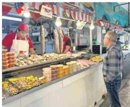
RESTAURANTES SON QUIENES MÁS COMPRAN LA REINETA.