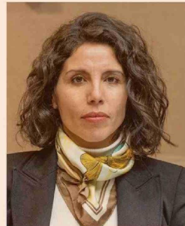
MARÍA JOSÉ GATICA, SENADORA DE RENOVACIÓN NACIONAL DE LA COMISIÓN DE HACIENDA.