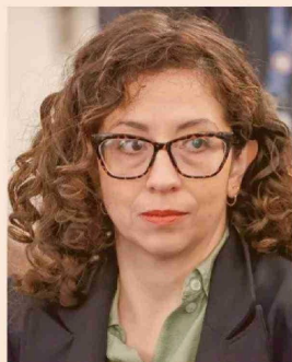
GAEL YEOMANS, DIPUTADA DEL FRENTE AMPLIO.