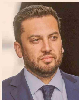
RAÚL SOTO, DIPUTADO DEL PPD.