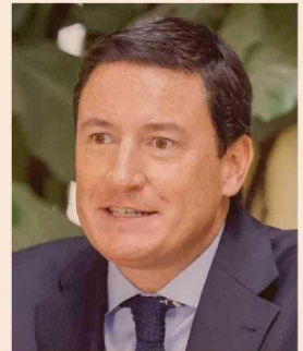
ARTURO SQUELLA, SENADOR Y PRESIDENTE DEL PARTIDO REPUBLICANO.