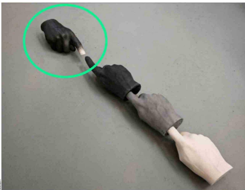
El ladrón se llevó la mano que se opone a las otras tres, de la obra "Intocables".

"En mi romanticismo por el arte espero que (el robo) sea porque dijeron que bacán esta pieza, que bonita, la quiero", dice Ruiz.