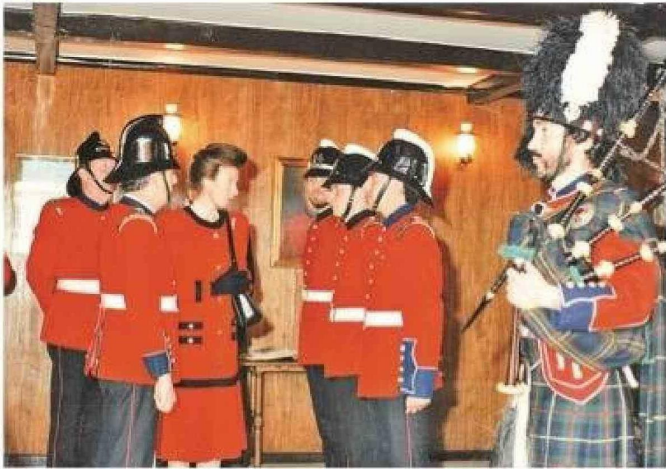
Es el gaitero oficial de la 14ª Compañía de Bomberos de Santiago, la British and Commonwealth Fire & Rescue Company. En 1991 estuvo presente en la visita de la princesa Ana de Inglaterra.

Tiraje: 3.000 Lectoría: 9.000 Favorabilidad: No Definida