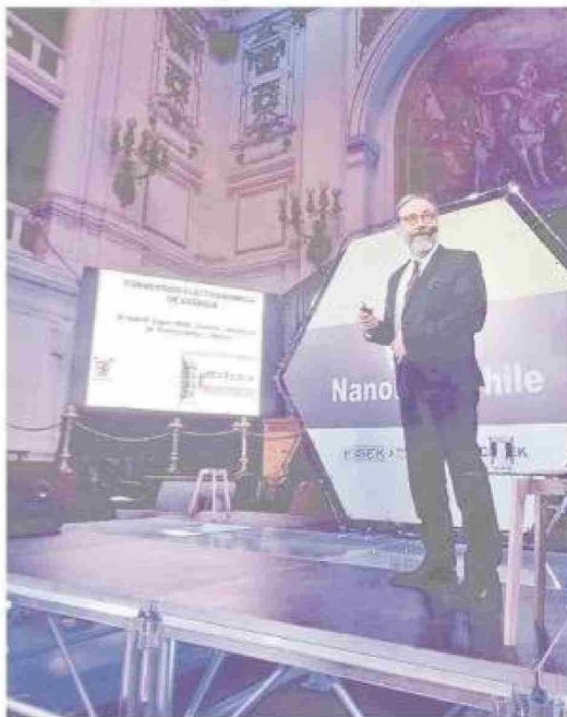
Desde hace décadas es profesor titular y académico distinguido de la Facultad de Química y Biología de la Universidad de Santiago de Chile.

Al preguntarle qué le diría a un científico joven, responde sin dudar: "Acostúmbrate a errar muchas veces, porque el éxito está lleno de errores. Las cosas no funcionan a la primera. Y la persistencia del científico es clave: los mejores son quienes insisten, insisten e insisten, hasta que salen las cosas como uno quiere, o de otra forma, pero estamos descubriendo. No hay que darse por vencido". Agrega también que la creatividad la estimula la falta de medios: "Cuando viene todo empaquetado, uno no se va a transformar en un cineasta mirando películas todos los días. Hay que inventar una película. Lo mismo es la ciencia: hay que inventar ciencias". Y que la sorpresa es un motor que no hay que dejar apagarse. Cuando era niño se sorprendía todos los días con la luna, el cielo de verano en Talca, el puntito luminoso del Sputnik pasando sobre los techos. Hoy, confiesa, ya no presta tanta atención. Se acostumbró. Pero en un avión dice que lo observa con curiosidad y se pregunta por cada pieza que lo conforma, por cada tornillo, como el niño de Talca que hacía experimentos.