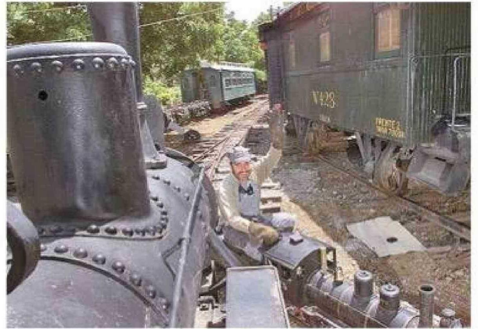
Con parte de la colección de trenes reales que mantiene en su parcela.