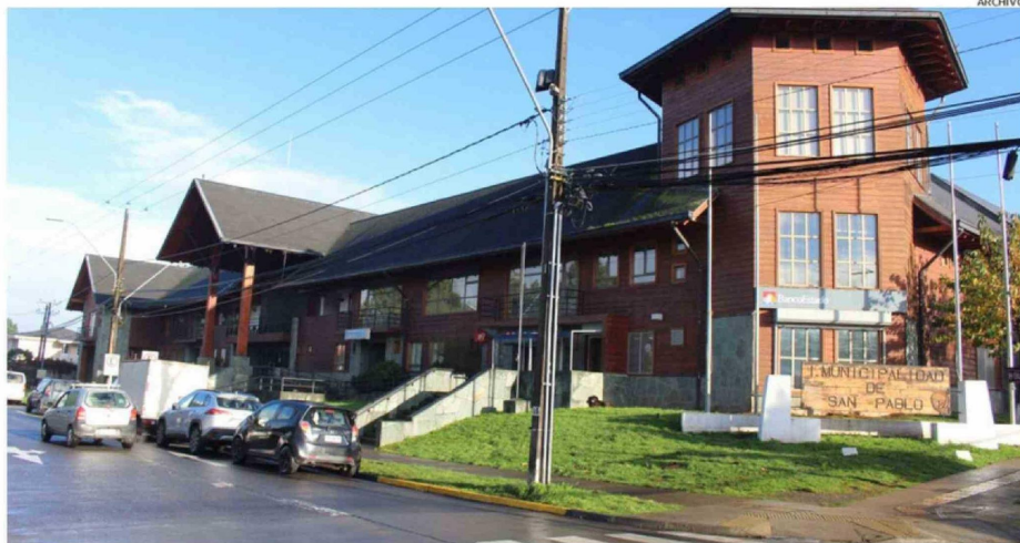
AUTORIDADES COMUNALES DE SAN PABLO ANALIZAN EL IMPACTO FINANCIERO EN LA OPERATIVIDAD MUNICIPAL.

el gasto adicional generado por el reciente aumento del combustible para 2026 en Osorno. Este incremento obliga a recortar partidas en actividades no esenciales.