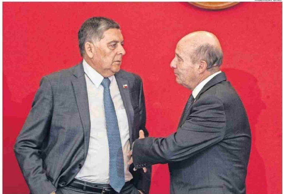
EL JEFE DE GABINETE Y EL MINISTRO DE HACIENDA HAN CAMINADO POR RUTAS DIFERENTES EN ESTE TEMA.

Sin embargo, ayer el ministro del Interior, Claudio Alvarado, tras una reunión con dirigentes, corrigió la posición: “El tema