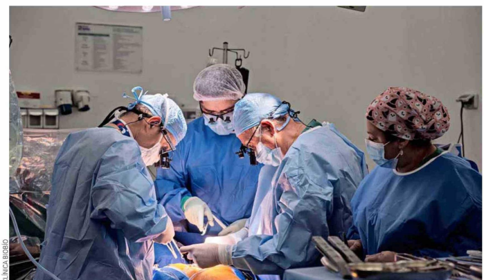
Equipo de cardiocirugía de Clínica Biobío.

Las enfermedades cardiovasculares son la principal causa de muerte en Chile. Según datos del Ministerio de Salud, entre 2023 y 2025, más de 90.000 personas fallecieron por patologías del sistema circulatorio. Durante años, los tratamientos de alta complejidad estuvieron concentrados en la capital, obligando a pacientes de regiones a trasladarse en condiciones muchas veces críticas. Clínica Biobío ha trabajado consistentemente para revertir esa realidad, consolidando un modelo de atención que articula las diferentes prestaciones que requieren personas con afecciones cardiovasculares, desde consultas cardiológicas, procedimientos endovasculares y la propia cirugía cardíaca; para lo cual ha sido parte fundamental el desarrollo de la Unidad de Paciente Crítico (UPC), altamente especializada, capaz de apoyar las necesidades de salud desde el diagnóstico hasta la recuperación. Prueba de lo anterior son las más de 1.000 cirugías cardíacas,