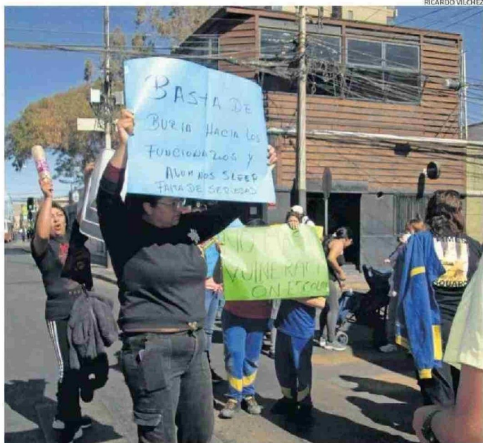
PROTESTAS DEL MARTES EN CALAMA. EL SLEP RECALCÓ QUE EL CORTE FUE PRODUCTO DE UN ERROR AJENO.

También se precisó que si bien la ley exige para estos cargos, que estuvieran en posesión de un título profesional de 10 semestres. "Para la contratación de los referidos profesionales, se tuvo a la vista la ex-