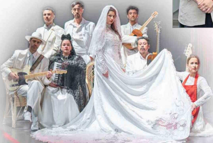
"Bodas de Sangre", obra producida por la U. Finis Terrae que integra la cartelera del Festival Internacional de Teatro a Mil 2026.