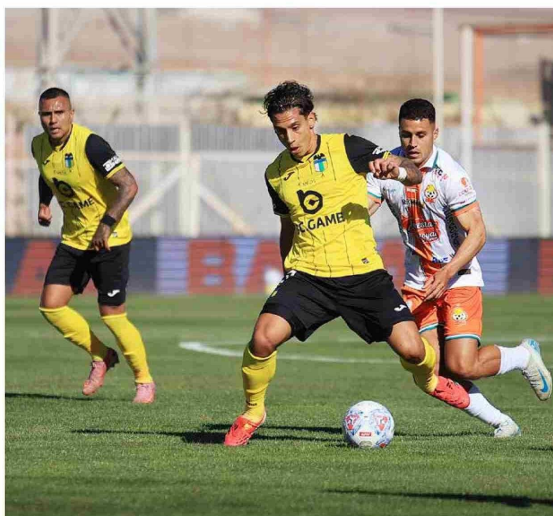
El Capo se repuso a un mal primer tiempo y en el segundo logró emparejar el trámite y hacerse del partido.