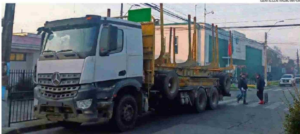
EL CHOFER DEL CAMIÓN, TRAS EL ATROPELLO, SE TRASLADÓ HASTA EL CUARTEL DE LA CUARTA COMISARÍA DE IMPERIAL Y ESTAMPÓ LA DENUNCIA.

Juan Carlos Poblete González juancarlospoblete@australtemuco.cl