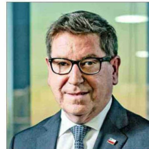
GERARDO JOFRÉ, EXPRESIDENTE DE CODELCO

“Ha habido un problema sin duda en la gestión en los últimos años (...) Que esa remodelación salga cuatro o cinco veces más que el presupuesto es una señal”.