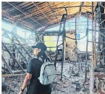
El recorrido por las salas da cuenta de la destrucción total.

Una historia que le pudo transmitir al Presidente Gabriel Boric en su visita a la zona el pasado miércoles, donde le pidió que “nuestra escuela se levantara y se pudiera reconstruir. El me aseguró que esto se va a hacer, y esperamos que haya una pronta respuesta del Mineduc. Sé que esto