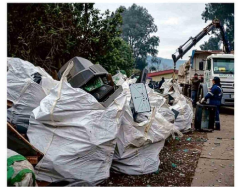
EN SU ÚLTIMA VERSIÓN, LA CAMPAÑA LOGRÓ RECOLECTAR MÁS DE 4.500 KILOS DE RESIDUOS ELECTRÓNICOS.

mentos contienen metales pesados y componentes peligrosos para el entorno natural, especialmente para cursos de agua y espacios públicos.