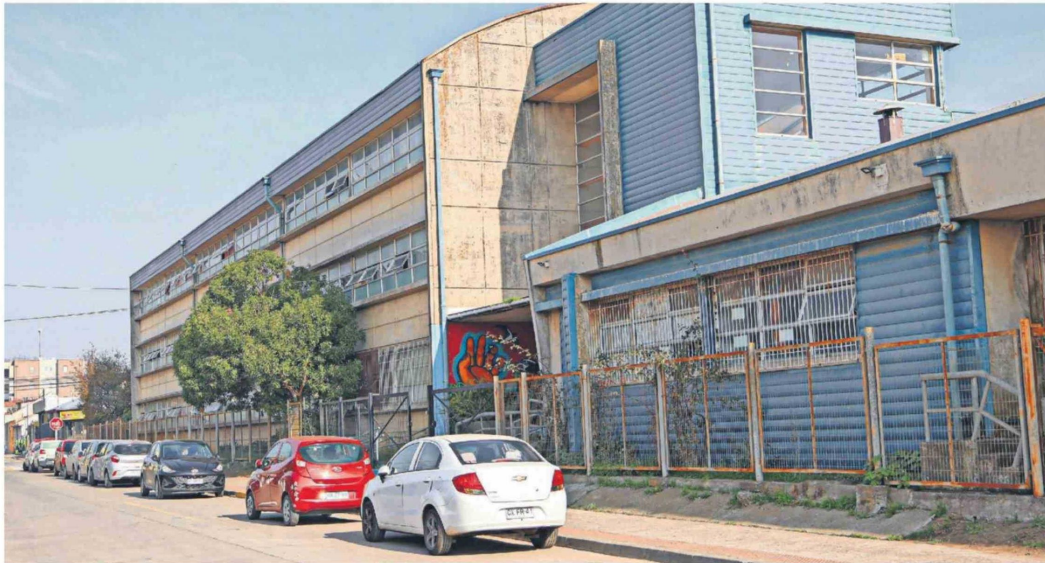
En Penco reciben de buena manera una posible pausa, pero siempre y cuando haya condiciones de mejora presupuestaria para infraestructura.

Municipios debaten sobre la idea de pausar o no el traspaso de los recintos educativos