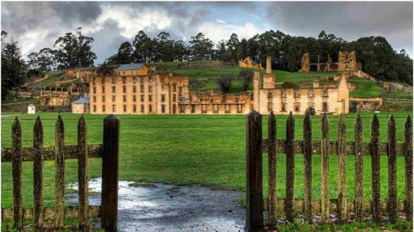
Vista del penal de Port Arthur y sus alrededores, escenario del tiroteo masivo más mortífero en la historia de Australia.

Título: El raid del joven que asesinó a más de treinta personas en un pueblo turístico australiano