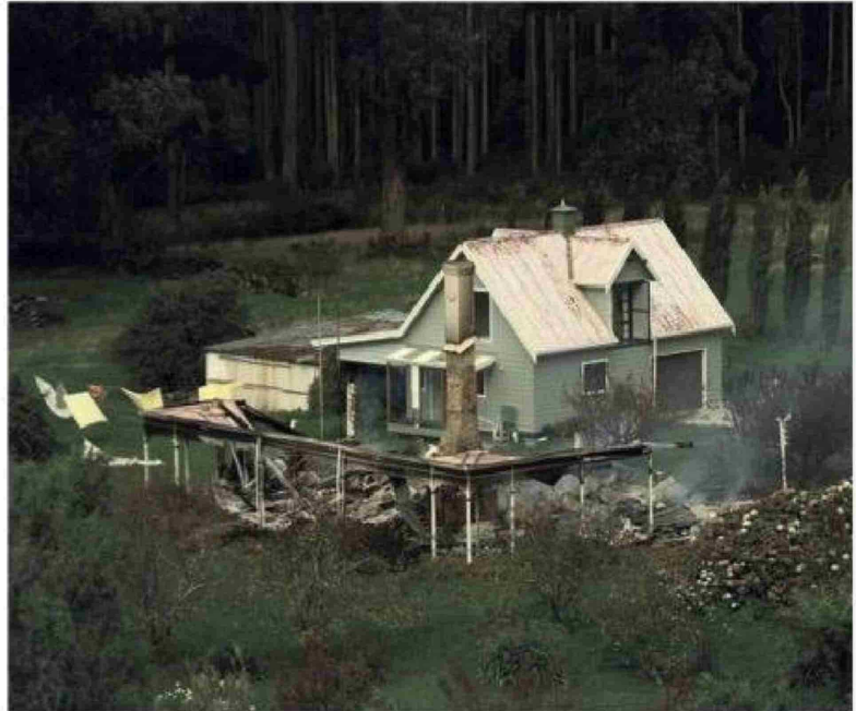
Los restos humeantes de la cabaña Seascapes, ubicada cerca de Port Arthur, tras el trágico tiroteo de 1996.