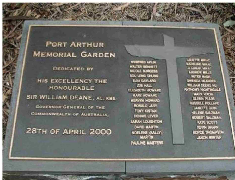
Placa conmemorativa de la masacre con los nombres de las víctimas.

El impacto no fue solo judicial. El 10 de mayo de 1996, apenas doce días después de la tragedia, el gobierno australiano impulsó el Acuerdo Nacional sobre Armas de Fuego. Esta reforma endureció el acceso a las armas, prohibió la tenencia de rifles y escopetas semiautomáticas, y estableció un sistema nacional de registro y licencias mucho más estricto.