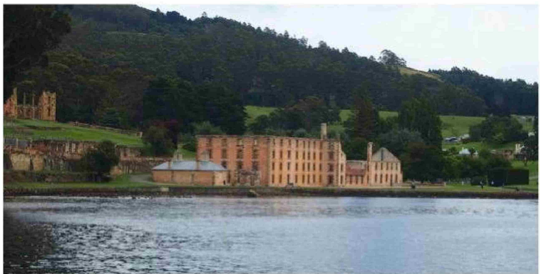
Alrededores de la prisión de Port Arthur, donde fallecieron 32 de las 36 víctimas.

Con el paso del tiempo, comenzó a mostrar falta de empatía, reacciones agresivas y comportamientos violentos. Hubo episodios de maltrato animal, destrucción de objetos y actitudes hostiles hacia