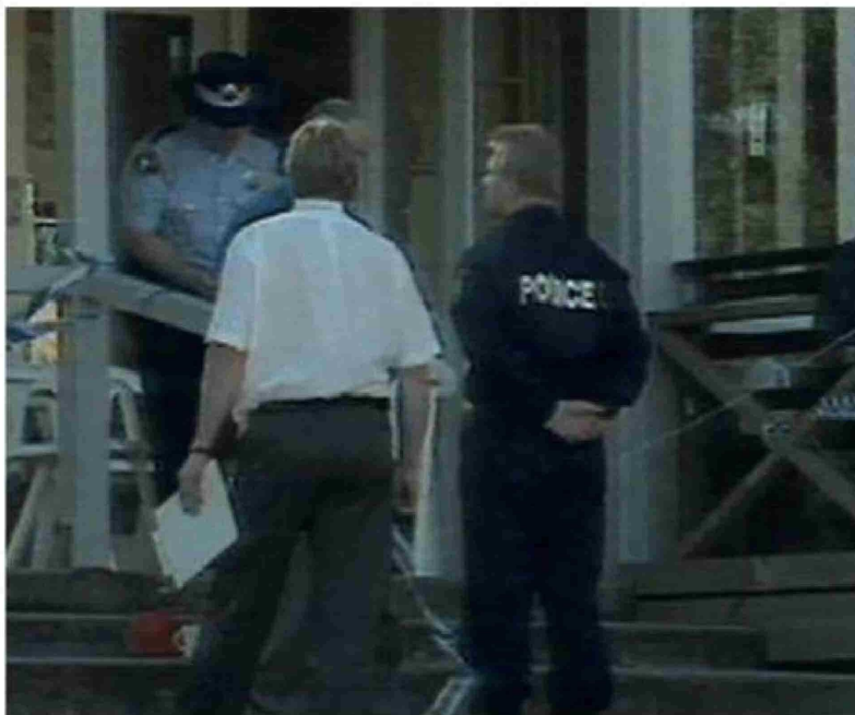
La policía en medio de la masacre.

Título: El raid del joven que asesinó a más de treinta personas en un pueblo turístico australiano