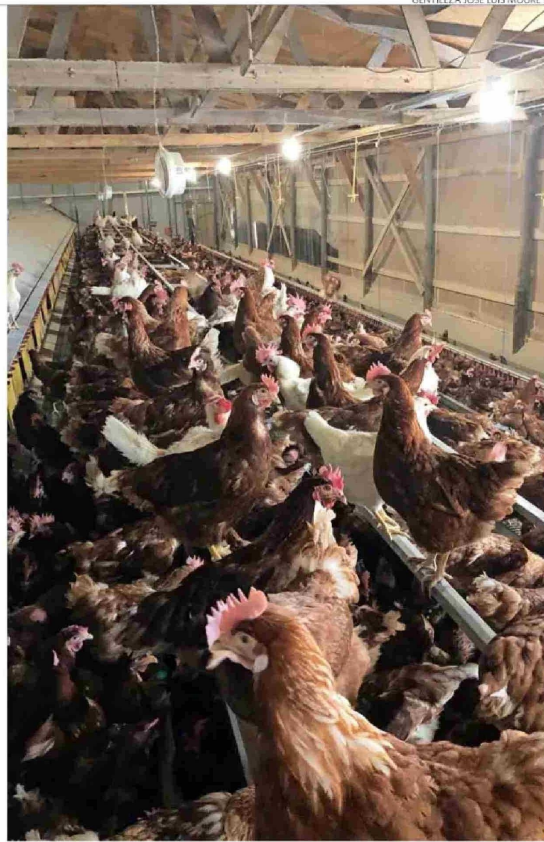
Las gallinas libres circulan sin restricciones dentro del galpón.

En 2016 tenían su primera producción de huevos de gallinas libres de jaula. “Es un nicho importante que ha tomado relevancia, pero hemos mantenido en paralelo la producción tradicional, porque eso nos