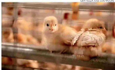
Los pollitos son los únicos en dónde se utiliza calefacción.

do. "Tenemos que generar instancias donde lo público con lo privado se sienten, conversen en una mesa, y logremos acuerdos que generen un beneficio para la población, para tener mejores alimentos y para tener una cadena de producción que esté de acuerdo con lo que nosotros queremos como país".