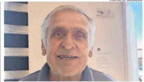
FUE EL FUNDADOR DE LA PIZZERIA DALLAS Y DE FRENOS FERNÁNDEZ.

Añadieron en la misiva, que en el marco del trabajo del actual Gobierno, "se han coordinado medidas preven-