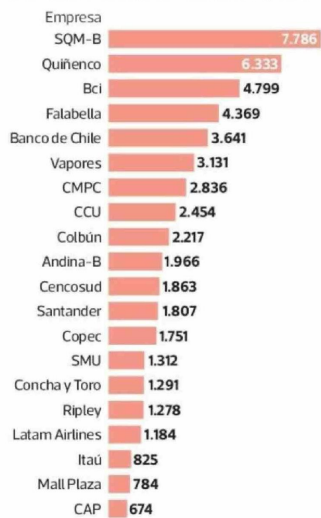
Las 20 empresas que pagan más en el total El desembolso total de cada empresa por remuneraciones de sus directores. En millones de pesos.