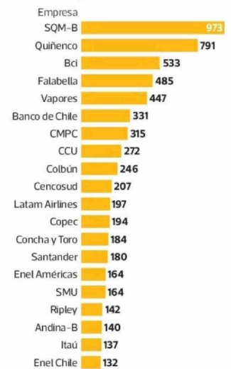
Las 20 compañías que desembolsan la mayor remuneración promedio por director En millones de pesos