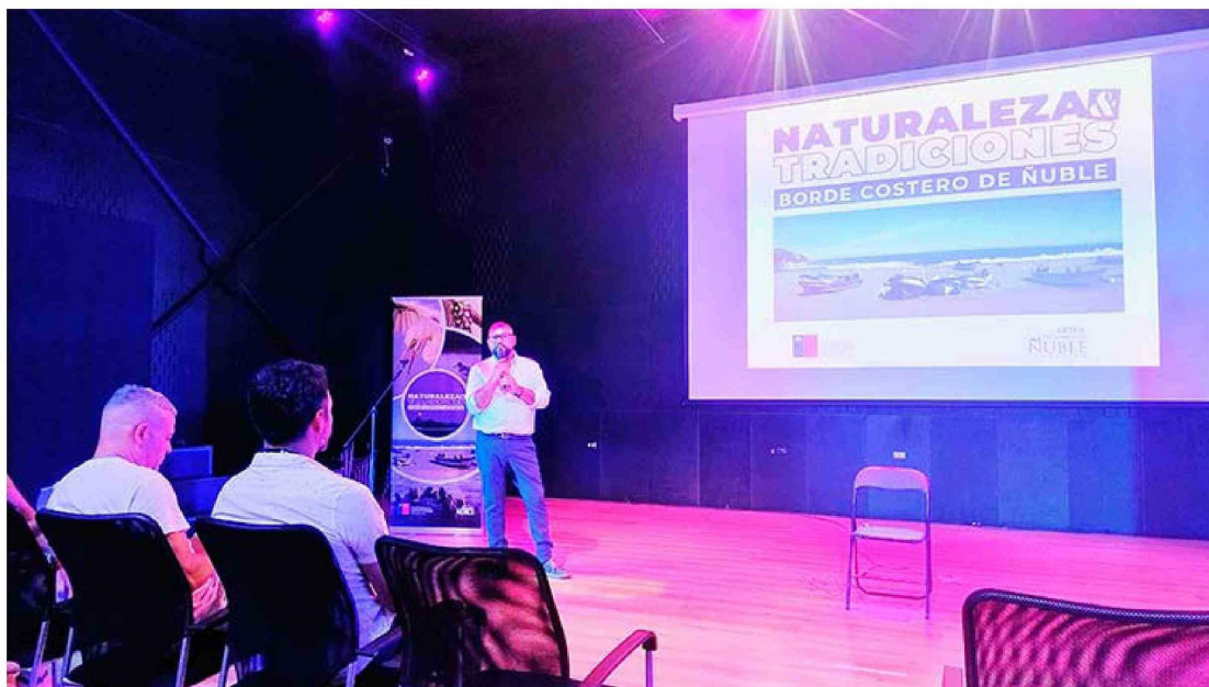
La presentación en Chillán se desarrolló esta semana en el Centro Cultural Municipal de Chillán, contó con una pequeña reflexión por parte de sus realizadores.

"La idea de este trabajo es difundir, conocer para preservar. En los colegios se enseña historia universal cuando tiene que ver con acontecimientos que sucedieron en el mundo, y también historia de Chile. Sin embargo, hay otras historias, que no se enseñan en los colegios y son igual de importantes: son las que han marcado la historia de un territorio, las historias locales", precisó el realizador.