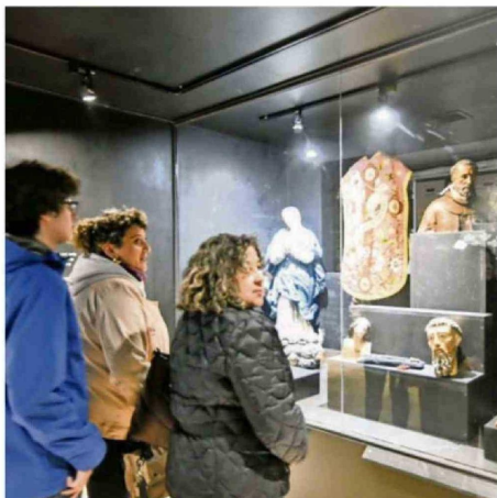
EL MUSEO DE LA CATEDRAL DE VALDIVIA RECIBIÓ A VISITANTES.