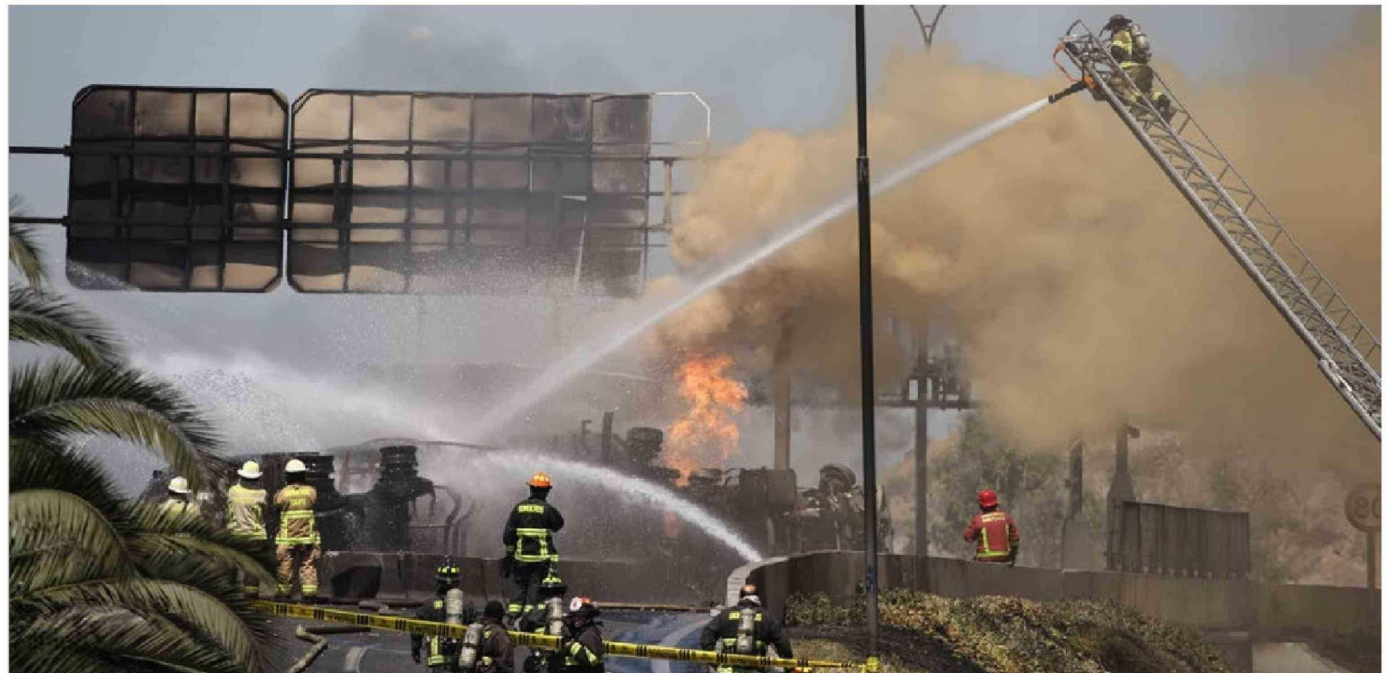
► El volcamiento fatal del vehículo de Gasco se produjo a las 8:06 horas de este jueves en la Autopista Central.