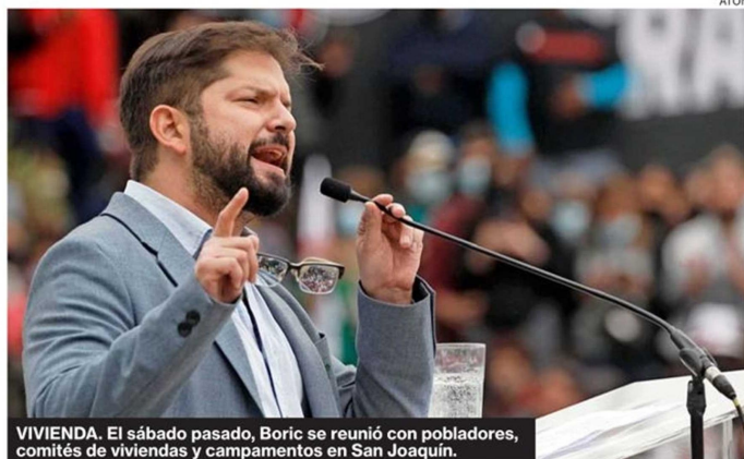
VIVIENDA. El sábado pasado, Boric se reunió con pobladores, comités de viviendas y campamentos en San Joaquín.

Tiraje: 11.692 Lectoría: 33.709 Favorabilidad: No Definida