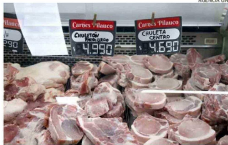
EL RUBRO HA TRATADO DE MANTENER LOS PRECIOS.

han llegado a bajar las ventas de carne de vacuno durante algunas semanas, ya que en general el público está acotando mucho sus gastos por el alza de productos y servicios.